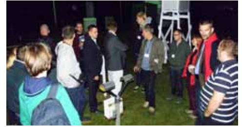
Sesja terenowa w ogródku meteorologicznym