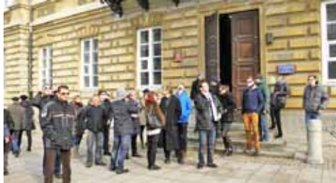
Obserwacje wizualne przed budynkiem Instytutu Geografii i Studiów Regionalnych UW