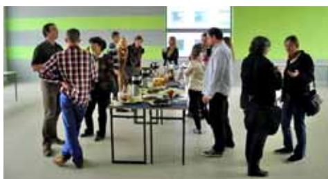
Przerwa i dyskusje kulturalowe