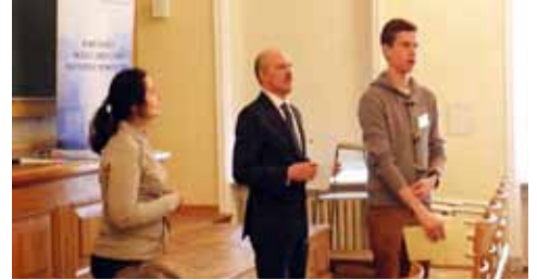
Moment wręczania certyfikatów uczestnikom warsztatów

Więcej na temat zakończonego seminarium: http://dostepdodanych.pl/uczestnicy