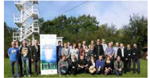
Uczestnicy warsztatów w Wrocławiu

Więcej na temat zakończonego seminarium: