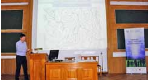
Prelekcję prowadzi Szymon Walczakiewicz