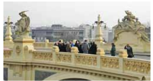
Wizyta na ulicy Karowej